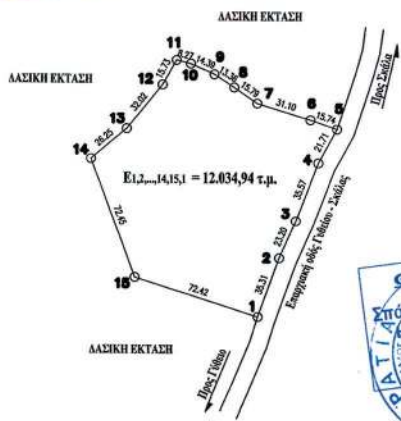
ΣΥΝΤΕΤΑΓΜΕΝΕΣ ΕΚΤΑΣΗΣ ΠΟΥ ΘΑ ΚΗΡΥΧΘΕΙ ΑΝΑΛΑΣΩΤΕΑ