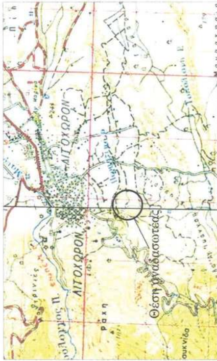
Γεωφωτοτικό σύστημα ΕΠΣΑ 87