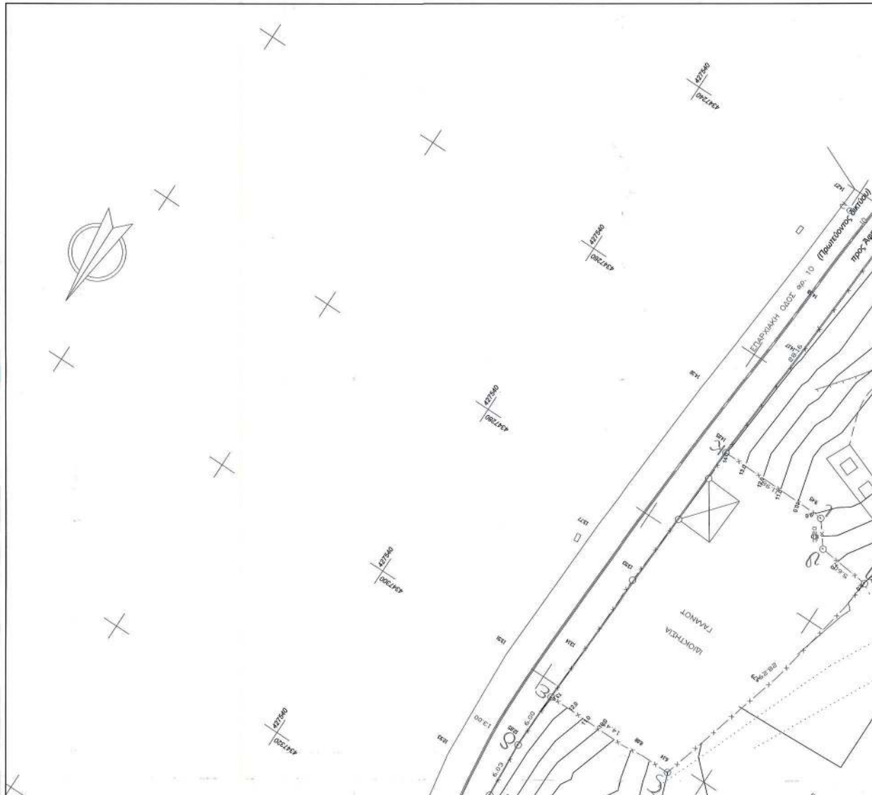
ΣΥΝΤΕΤΑΓΜΕΝΕΣ ΟΡΙΟΤΡΑΜΜΗΣ (ΕΓΣΑ '87)