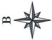
ΑΠΟΣΠΑΣΜΑ ΤΟΥ ΜΕΡΙΚΟΣ ΚΥΡΩΜΕΝΟΥ ΔΑΣΙΚΟΥ ΧΑΡΤΗ Π.Ε. ΛΑΚΟΝΙΑΣ

ΠΡΟΤΑΣΗ ΜΕΡΙΚΗΣ ΑΝΑΚΛΗΣΗΣ ΤΗΣ ΥΠ ΑΡΙΘ. 1480/30.08.1989 ΑΠΟΦΑΣΗΣ ΚΗΡΥΞΗΣ ΕΚΤΑΣΕΩΣ ΑΝΑΔΑΣΤΕΑΣ ΛΟΤΙΣ ΠΥΡΚΑΤΙΑΣ ΤΟΥ ΝΟΜΑΡΧΗ ΛΑΚΟΝΙΑΣ (ΦΕΚ 1358/7.ΔΙΟΕ.10.1983) ΓΙΑ ΕΚΤΑΣΗ ΕΜΒΛΑΔΟΥ 759.967,09 τμ (Ε 1.2.3.....493.494.495.1-Τμήμα 1 - Τμήμα 2 = 763822,88τμ -1503,40 τμ -2152,40 τμ) ΣΤΗ ΘΕΣΗ: ΠΛΑΚΟΥΜΑΙΚΑ-Τ.Κ. ΛΟΓΓΑΝΙΚΟΥ ΔΗΜ. ΕΝΟΤΗΤΑΣ ΠΕΛΛΑΝΑΣ ΔΗΜΟΥ ΣΠΑΡΤΗΣ Η ΟΠΟΙΑ ΦΕΡΕΙ ΤΟΝ ΧΑΡΑΚΤΗΡΙΣΜΟ ΑΝ ΑΑ ΣΤΟΝ ΠΡΟΣΩΡΙΝΟ ΔΑΣΙΚΟ ΧΑΡΤΗ Π.Ε. ΛΑΚΟΝΙΑΣ Ο ΟΠΟΙΟΣ ΘΕΩΡΗΘΗΚΕ ΜΕ ΤΗΝ ΥΠ ΑΡΙΘΜ. 1943/27.01.2017 ΑΠΟΦΑΣΗ ΔΙΕΥΣΗΣ ΔΑΣΩΝ Π.Ε. ΛΑΚΟΝΙΑΣ ΚΑΙ Η ΟΠΟΙΑ ΕΧΕΙ ΕΞΑΙΡΕΘΕΙ ΤΗΣ ΚΥΡΩΣΗΣ ΣΤΟΝ ΜΕΡΙΚΟΣ ΚΥΡΩΜΕΝΟ ΔΑΣΙΚΟ ΧΑΡΤΗ Π.Ε. ΛΑΚΟΝΙΑΣ (ΦΕΚ 529/24.14.02.2019) ΚΥΜΑΚΑ 1.8000