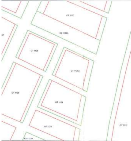
ΠΛΑΣΜΑ ΡΥΜΟΤΟΜΙΑΣ ΚΛΙΜΑΚΑ 1:1000