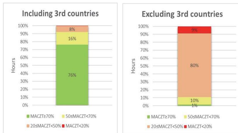
Figure 1. Percentage of time with achieved Margins Available for Cross-Zonal Trade in 2021. Not considering periods when GR-BG interconnection was out of service and periods where calculations were not possible due to insufficient data.