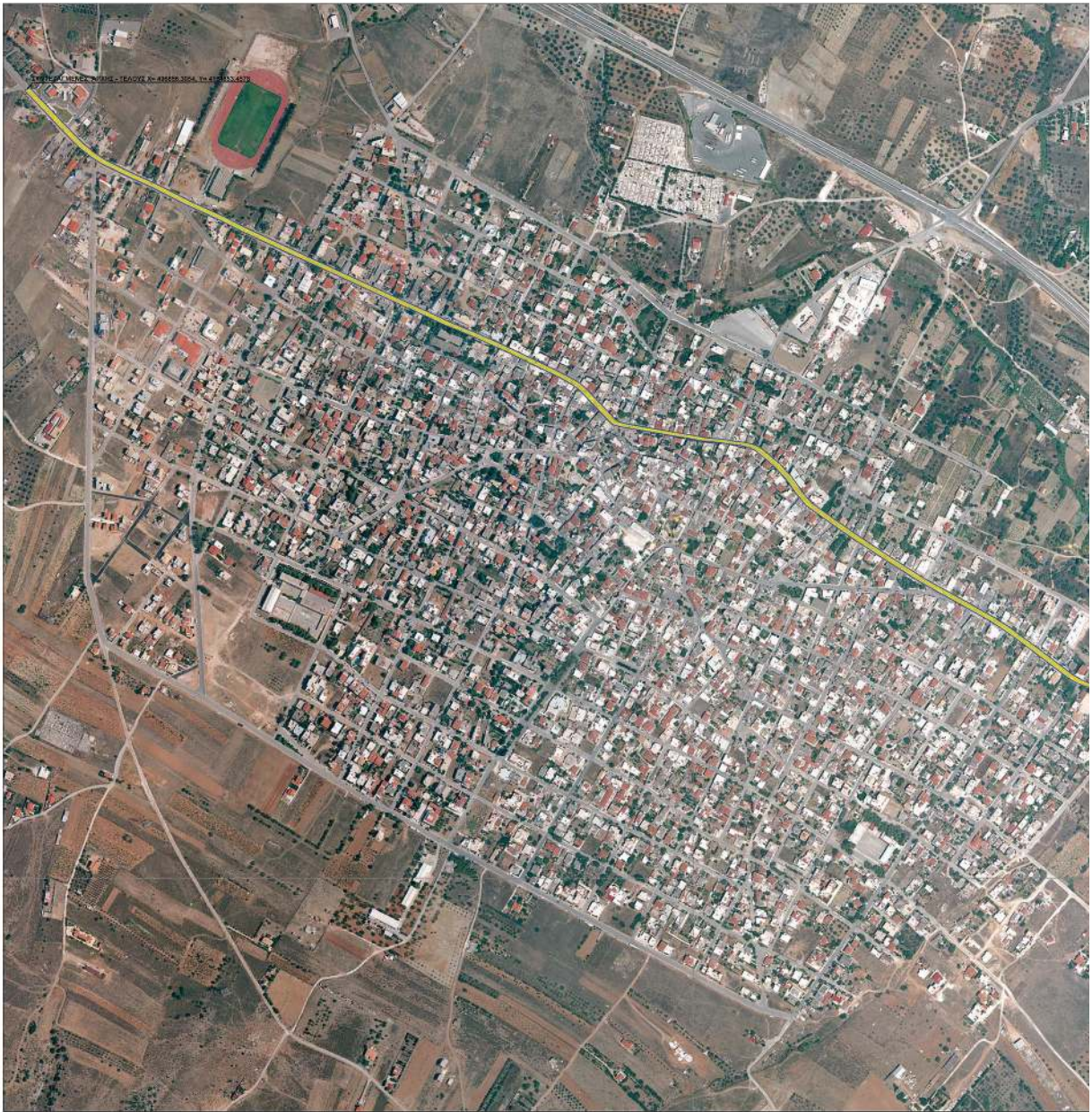
ΕΘΝΙΚΟ ΤΥΠΟΓΡΑΦΕΙΟ Για τεχνικούς λόγους στο σχεδιάγραμμα, από το ηλεκτρονικό αρχείο, έγινε σμίκρυνση κατά ποσοστό 30%